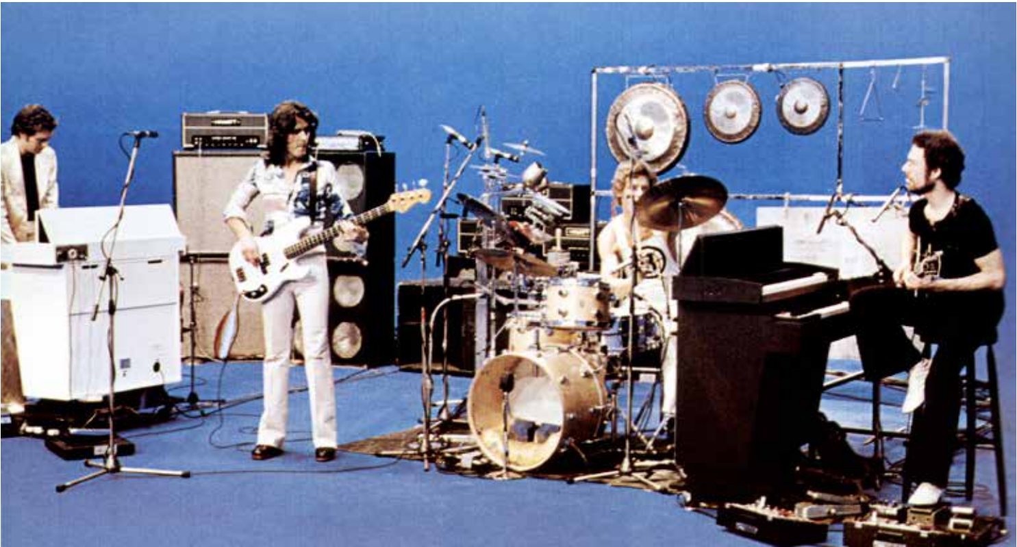
King Crimson topper listen med albumet « In the Court of the Crimson King». Her er bandets medlemmer David Cross (fra venstre), John Wetton, Bill Bruford og Robert Fripp på et fransk tv-program i 1974.

Det største fyrtårnet er likevel King Crimson, skal vi tro juryens flertall. I tillegg til at bandet troner øverst på listen, er det også inne med to album til: «Lark's Tongue in Aspic», der det hadde fått med fiolinvirtuosen David Cross og Yes-trommeslageren Bill Bruford, og den overstyrte gitarfesten Red. Best av alle er likevel «In the Court of the Crimson King» - en plate som regnes som et av de mest vågale debutalbum noensinne. Det har et av de mest gjenkjenne-lige progplatecoverne, der øynene