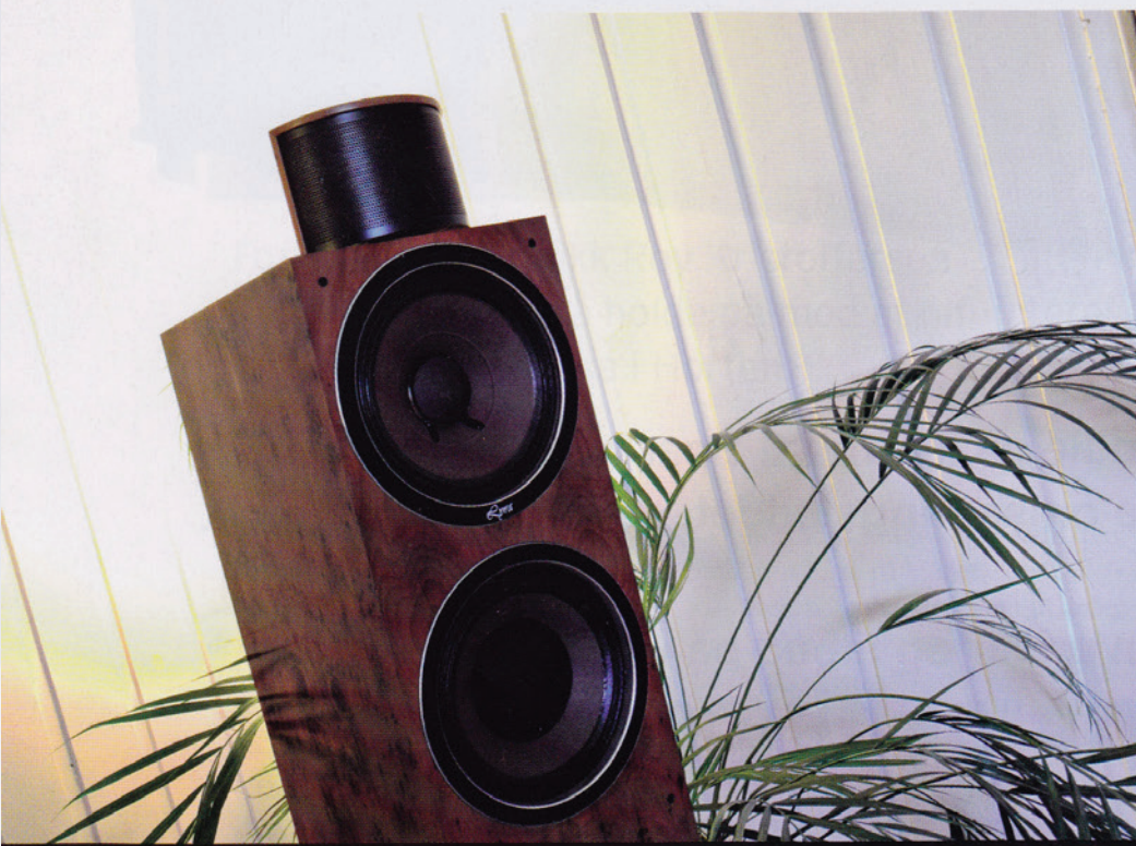
16 TOMMER PER HØYTTALER: Hver av høyttalerne har doble åtte-tommere. De spiller fra ca. 1100 hertz og ned. Diskanten tar alt over.

viktig for deg, er noe annet, poengterer han.