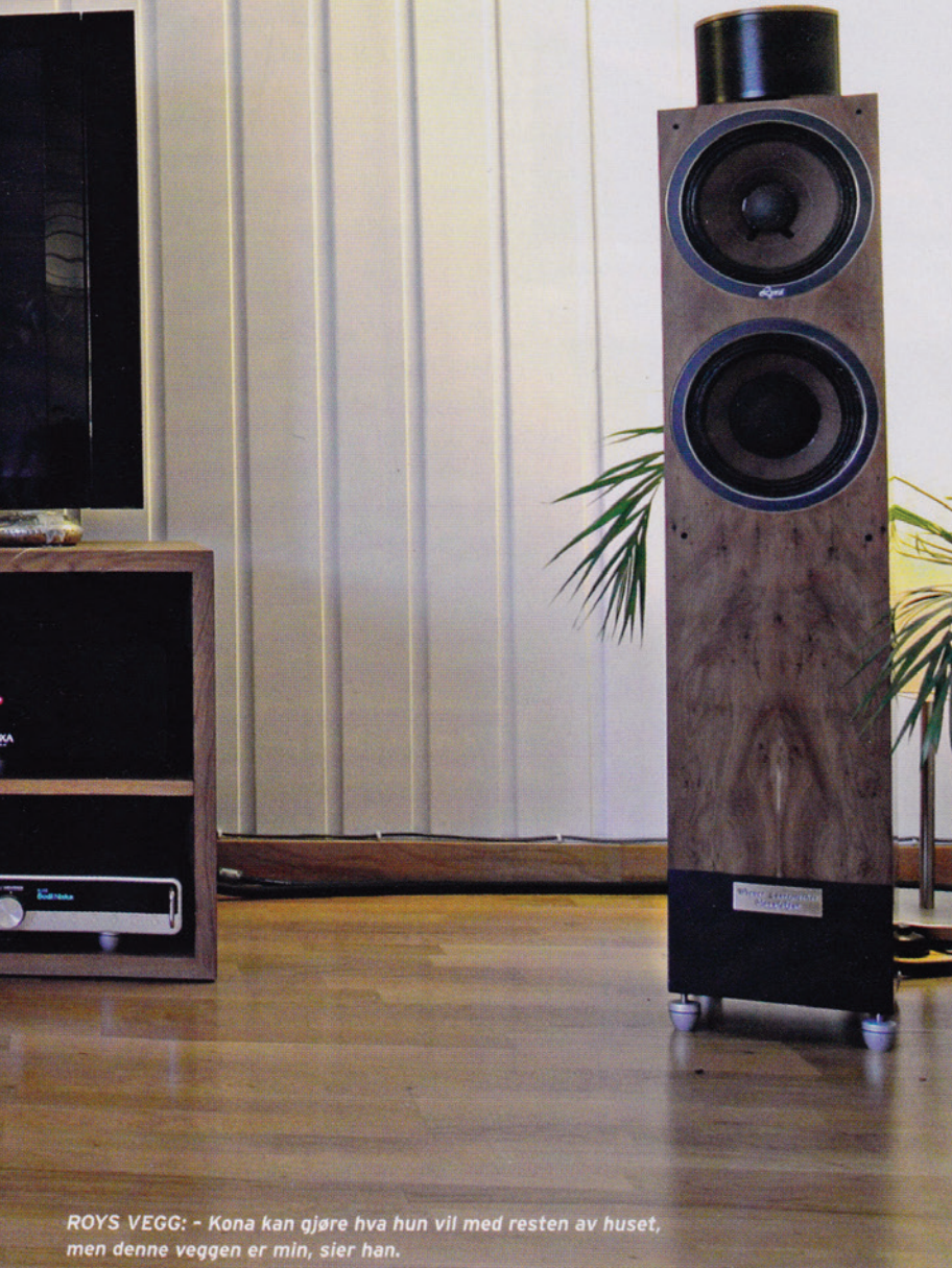
ROYS VEGG: - Kona kan gjøre hva hun vil med resten av huset, men denne veggen er min, sier han.

Jeg hadde hørt Doxa 8.1-høytalerne tidligere, men hadde alltid fått inntrykk av det som litt sedate og daffe høyttalere. Nå var det futt og fres i lyden, så jeg skjønnte at de nye Doxa-forsterkerne stod for magien, sier han.