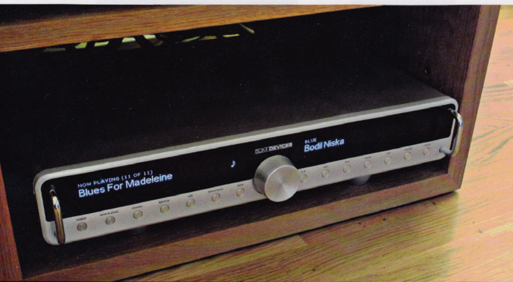
GJØR SEG IKKE BORT: Slim Devices Transporter begynner å bli noen år, men selv den innebygde konverteren er god. Som rent drivverk er det umulig å skille lyden fra cd-drivverket i Burmester-spilleren, mener Roy.