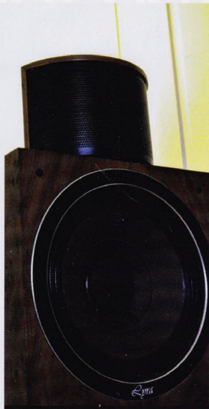
IKKE BÅND: Diskanten på WLM Lyra mk2 kan se ut som bånddiskanter, men er i stedet to papirdomer på to tommer som peker hver sin retning. Det gir stort lydbilde.

- Ofte er det slik at når man bytter komponenter så er det gjerne større