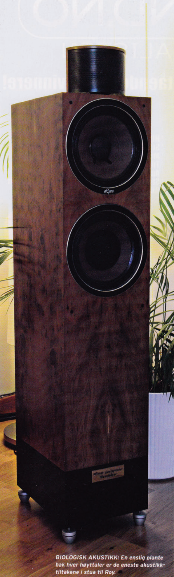
BIOLOGISK AKUSTIKK: En enslig plante bak hver høyttaler er de eneste akustikk-tiltakene i stua til Roy.