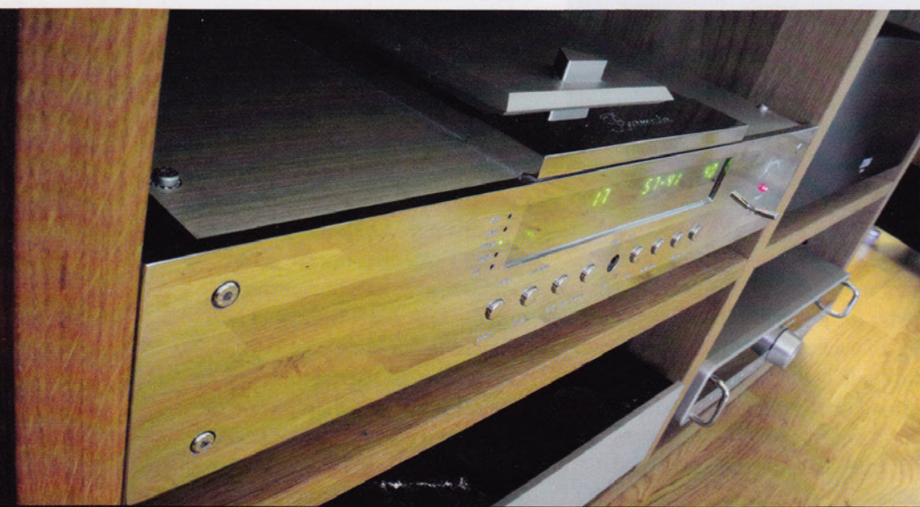
EIKEFINISH: Både rack og gulv er i eik, og den blanke fronten til Burmester-spilleren spiller gulvet perfekt.