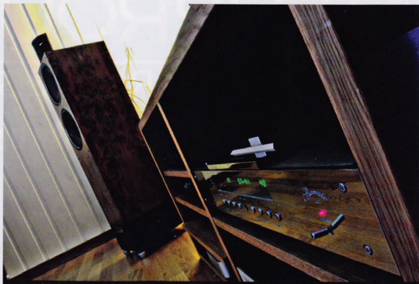
LEKKER FINISH: Høyttalerne fra WLM har fantastisk trefinish, men fronten skjemmes noe av at de har vært eksponert for sollys hos en forhandler i California før de ble sendt til New Zealand og deretter til Norge.

– Jeg fikk katalogen fra Hifiklubben i posten fra jeg var 14 år og maste i to år før jeg fikk kjøpt meg en NAD 3020 forsterker og en cd-spiller fra NAD i samme serie. Høyttalerne var noen gamle Jamo som jeg lånte av mamma og pappa, sier han.